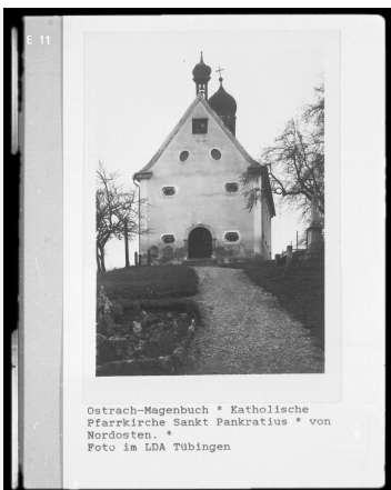
Ostrach-Magenbuch * Katholische Pfarrikirche Sankt Pankratius * von Nordosten, * Foto im LNA Tübingen