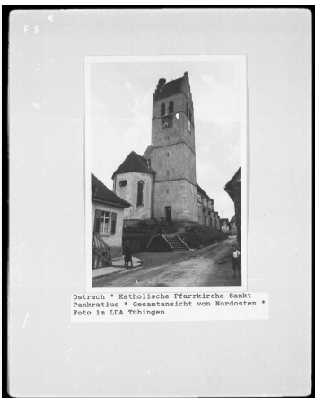
Ostrach • Katholische Pfarrkirche Sankt Pankratius • Gesamtansicht von Nordosten